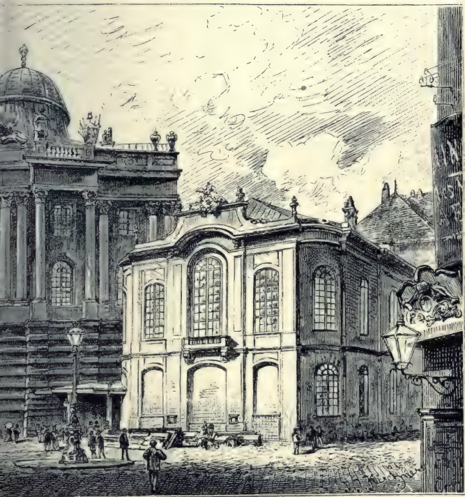
Das alte Burgtheater